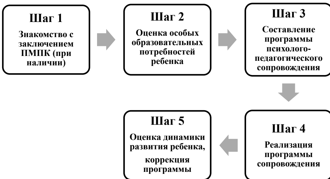
Рисунок 3. Алгоритм действий дошкольной организации.

Таким образом, в заключении ПМПК с целью удовлетворения особых образовательных потребностей указываются необходимые ребенку специалисты службы психолого-педагогического сопровождения, которые осуществляют собственную оценку особых образовательных потребностей ребенка и разрабатывают индивидуально-развивающие или коррекционно-развивающие программы, проводят занятия в разном формате с этим ребенком.